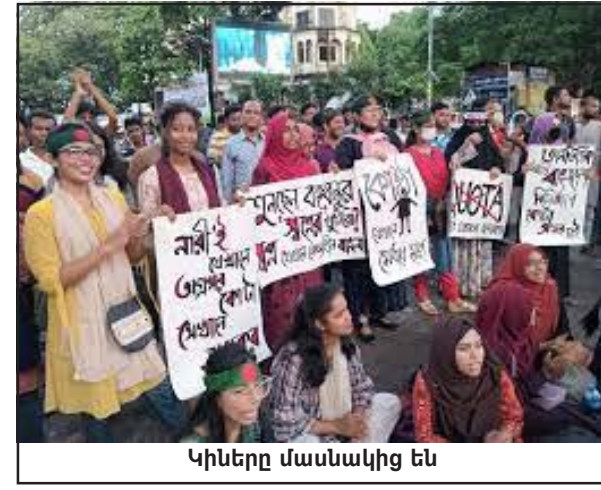
Կիները մասնակից են

սակայն ո՛չ՝ բանակը (սկզբնական փուլին), որ իշխանութեան կողմէ գործի հանուեցաւ ճնշելու ցոյցերը: Բանի մը օրուան մէջ, վիճակը դարձաւ անհակակշռելի: Մայրաքաղաք Տաքայէն մինչեւ այլ մեծ ու փոքր քաղաքներ վարակուեցան բողոքողներու բազմութիւններով: Որոշ օրեր, ցուցարարներու թիւը գնահատուեցաւ միլիոնով: Ուսանողներուն սկսած շարժումը գտաւ լայն ժողովրդականութիւն, որովհետեւ մարդիկ դժգոհ էին տնտեսական եւ ընկերային գետիններու վրայ աղետալի նահանջներէն (սղաճ, սուղ դրամանիշներու պահեստի նահանջ եւ այլն):