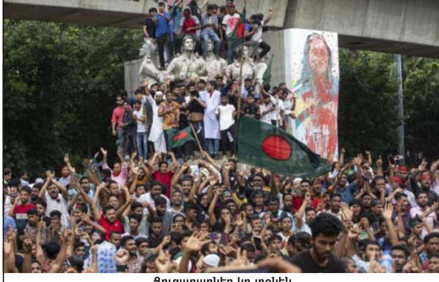
Յուցարարներ կը տօնեն

...Ուշագրաւ էր, որ նահանջի յորդորներու ու խաբէութեան տոպրակը կռնակը առած է Բերքաբեր գացած վարչապետը «Դուխով» արձանագրութեամբ գլխարկը չի գործածեր երկարատեն ի վեր: