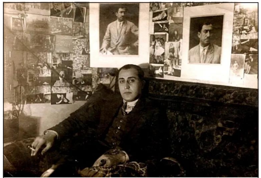
Համօ Բեկ Նազարեան (1891-1965)