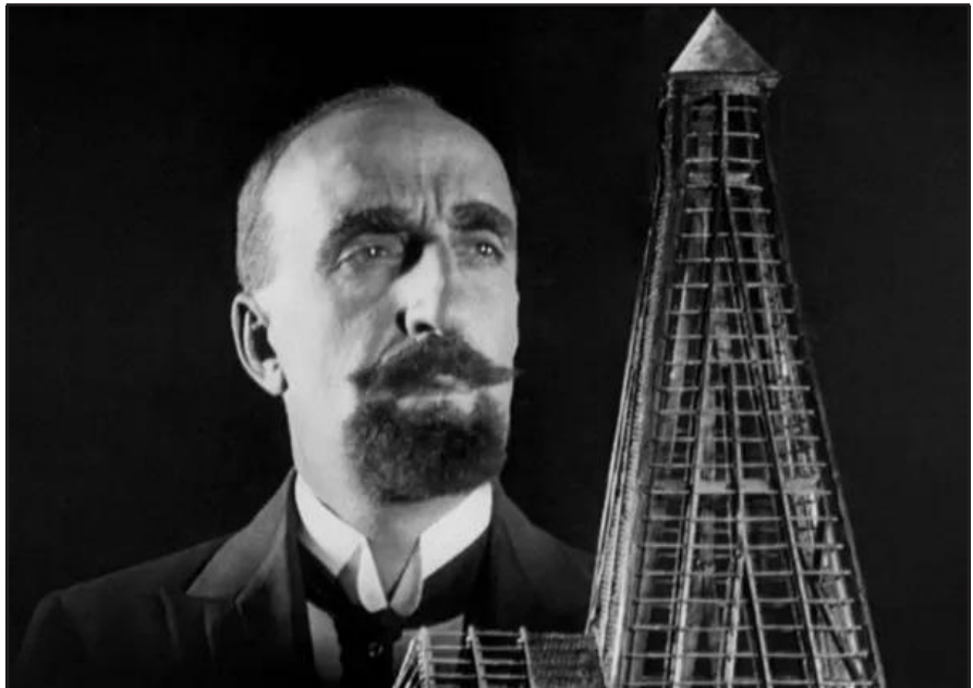
«Տունը Զրաբուխի Վրայ» ֆիլմին մէջ ներկայացուած քարիւղային ոլորտի հայ շահագործող շուքի մը դիմանկարը:

Յետաքրքրականը այն է, որ 20-րդ դարասկիզբի Պաքուի քարիւղային տնտեսական բարգաւաճման օրերուն թուրք եւ իրեայ քարիւղային անագ առեւտրականները աւելի շատ էին, քան հայերը: Այդուհանդերձ, Բեկ Նազարեան Նախընտրեց «Տունը Զրաբուխի Վրայ» ֆիլմին չարագործները դարձնել քարիւղի հայ մեծ վաճառականներն ու անոնց գործընկերները: Պատմականօրէն, Սուհա Պոլուքփաշինի նման հեղինակներ կը վկայեն, որ իրականութեան մէջ Ռուսիոյ կայսերական եւ խորհրդային դեկավարութիւնն էր, որ լարուածութիւն եւ անվստահութիւն կը ստեղծէր հայերու եւ ազերի-