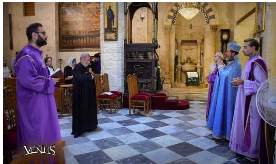
խահայութեան եւ հայ ժողովուրդին կեանքը: Ս. Գրիգոր Լուսավորիչ եկեղեց-

Գ. Զրտիկը թափել, այնպէս ինչպէս Զրիստոս տագնապելով ար-