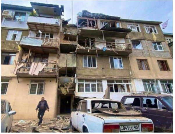
Այն նախագահի աշխատակազմի տեղեկատուութեան գլխավոր վարչություն

թիւնը՝ Ատրպեյճան 19 Սեպտեմբերին լայնամասշտապ զինուորական գործողություններ սկսած է Արցախի Հանրապետութեան նկատմամբ՝ թիրախաւորելով նաեւ քաղաքացիական տուեալներն ու խաղաղ բնակչութիւնը, որուն հետեւանքով կան գոհեր եւ վիրաւորներ՝ կիներ, տարեցներ եւ երեխաներ: Ատրպեյճանի գործողությունները ոչ այլ ինչ են, քան ցեղային գտում եւ ցեղասպան քաղաքականութիւն, զորս իրականացնելով Պաքուն կը շահարկէ մարդկային միջանցքի եւ մարդասիրութեան այլ կեղծ օրակարգեր: Արցախի Հանրապետութեան նախագահ Սամուէլ Շահրամանեան անմիջապէս հրաւիրած է Անվտանգութեան Խորհուրդի նիստը եւ քննարկած ստեղծուած իրավիճակն ու հետագայ ընելիքները: Նկատի առնելով հազարաւոր մարդոց կեանքին ու անողջութեան սպառնացող վտանգը՝ պաշտօնական Ստեփանակերտը կը կ'ուղղէ միջազգային դերակատարներուն եւ շահագրգիռ բոլոր կողմերուն անյապաղ ձեռնարկելու անհրաժեշտ բոլոր միջոցներուն՝ Արցախի նկատմամբ յարձակումը դադարեցնելու համար: Արցախի Հանրապետութիւնը մշտապէս եղած է խաղաղ կարգաւորման կողմնակից եւ կը վերահաստատէ իր պատրաստակամութիւնը՝ բոլոր հարցերու լուծման համարելու բանակցություններու միջոցով: