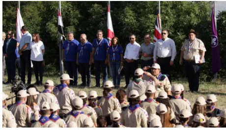
Շար.՝ Էջ 6 >

Տարուան մը ակամայ ուշացումով, Ուրբաթ, 21 Յուլիսի երեկոյեան ժամը 6:15-ին (Երեւանի ժամանակացոյցով), Բիւրականի «Գառնիկ Մկրտիչեան» սկաւտական բանակավայրին մէջ ընթացք առաւ համա-ՀՄԸՄ-ական 12-րդ բանակումը՝ բացման արարողութեամբ մը, որուն ներկայ գտնուեցան ՀՀ Բիւրոյի անդամ Արսէն Համբարձումեան, ՀՀ Զայաստանի Գերագոյն Մարմինի ներկայացուցիչ Իշխան Սաղաթելեան, ՀՄԸՄ-ի Կեդրոնական Վարչութեան ատենապետ Վաչէ Նաճարեան, անդամներ՝ Դաւիթ Յակոբ-