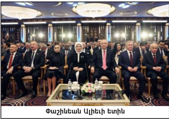
Փաշինեան Ալիեւի ետին