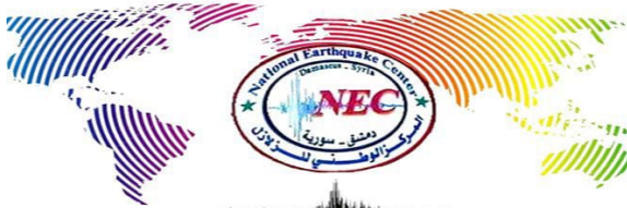
#المركز الوطني للزلازل

-Երեքշաբթի, 6 Յունիսին 2023-ին, սուրիական Երկրաշարժներու Գրանցման Ազգային կեդրոնը յայտարարեց, որ 8 յետցնցումային երկրաշարժ արձանագրուեցաւ 1,7 - 4,1 ռիխթըր ուժգնութեամբ: Իսկ յաջորդ առաւօտեան ժամը 7:58-ին, թեթեւ յետցնցումային երկրաշարժ մը արձանագրուեցաւ Ռաքքայի հիւսիսարեւելեան շրջանին մէջ, 2,8 ռիխթըր ուժգնութեամբ եւ 6,2 ք.մ. խորունկութեամբ: