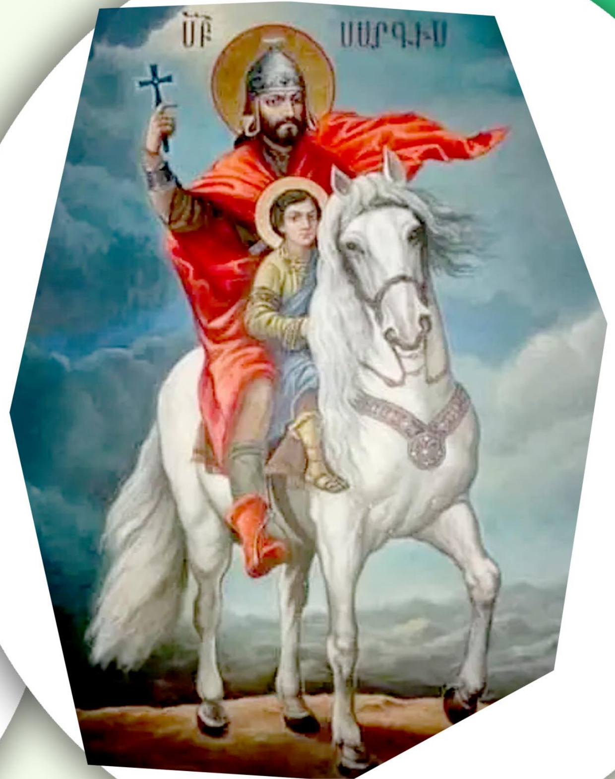
ԹԻՒ ԴԱՏՐԱՍՏԵՑ՝ ՄԱՐՄԻՆԻ ԱՇՈՏԵԱՆ-ՇԱՀԻՆԵԱՆ ՆԿԱՐԱԶԱՐՈՒՅՑ՝ ՈՒՅՅՈՒ ՔՇՈՒՇԵԱՆ

Ս. Սարգիսի տօնը մեծ ժողովրդականութիւն ունի հայ ժողովուրդին մօտ, յատկապէս՝ երիտասարդներուն: