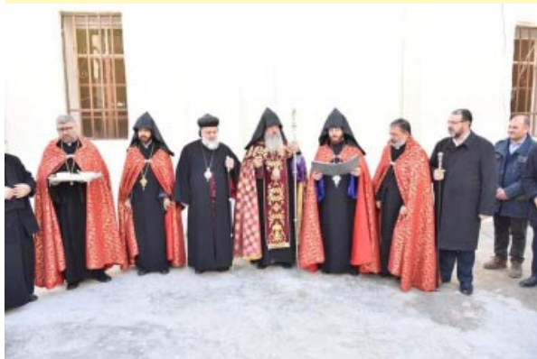
Մակար Սրբազան ժողովուրդին փոխանցեց ՆՍՕՏՏ Արամ Ա. Վեհափառ Հայրապետին ողջոյնները, հայրական սերը եւ օրհնութիւնները, յայտնելով, որ ան միշտ կը յիշէ իր հօտի գաւակները եւ աղօթակից է մեզի: «Ազգային Ընդ. Ժողովի երեք օրերու ընթացքին Վեհափառ Հայրապետ իր մտքին առանցքը դարձուցած էր սուրիահայրութիւնը, Սուրիան եւ լիբանանահայութիւնը, որպէսզի կարենանք գոյատեւել, շարունակել եւ ոտքի կանգնիլ», աւելցուց Սրբազան Հայրը:

Ճեզիրեի Առաջնորդական Փոխանորդ Հոգ. Ս. Լեւոն Վրդ. Եղիայեան, Ճեզիրեի թաղականութեան, ազգային, մարդասիրական եւ բարեսիրական միութիւններուն անունով բարի գալուստ մաղթեց