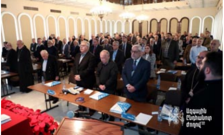
Կարողանանք շարունակել մեր առաքելութիւնը:

Աւարտին, Վեհափառ Հայրապետը անգամ մը եւս իր գնահատանքը յայտնեց ժողովին եւ աղօթք բարձրացուց առ բարձրեալն Աստուած, որ ծաղկեցնէ, հզօրացնէ, լուսաւորէ եւ պայծառակերպէ հայ ժողովուրդին կեանքը՝ Հայաստանի, Արցախի եւ Սփիւռքի մէջ, անսասան պահէ մեր եկեղեցին ու հայրենիքը այս դժուարին օրերուն, որպէսզի միասնական ոգիով