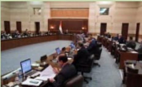
Շար. էջ 6 >

Չորեքշաբթի, 3 Օգոստոս 2022-ին, Սուրիոյ Նախագահ Պաշար ալ-Ասատ հրապարակեց 2022-ի «216» թուակիր հրամանագիրը, որուն համաձայն Կիրակի, 18 Սեպտեմբեր 2022-ը ճշդուեցաւ Սուրիոյ մէջ տեղական խորհուրդներու նոր շրջանի ընտրութեան օր: