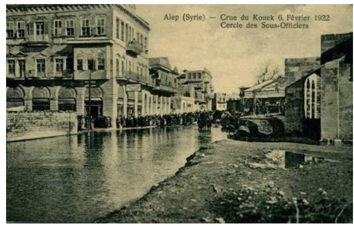
Alep (Syrie) — Crue du Kouek 6, Février 1922 Cercle des Sous-Officiers

Հալէպի բրիտանական հիւպատոս Ադեքսադր Ռուսել օրին կ'անդրադառնայ Հելլանէի Նշանաւոր ջրանցքին ու Հալէպի շրջակայքի արտերուն: