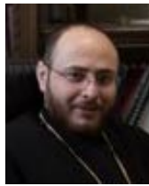
Թարգմանեց՝ Լեւոն Վրդ. Եղիայեան

Դաւիթ իր ապաշխարութեան ընթացքին շատ լացաւ եւ իր Սաղմոսները հեծկլտուքով, արցունքով եւ տխրութեամբ լեցունեցան՝ իր կատարած մեղքերուն համար: Ապաշխարութեան սաղմոսներէն մէկուն մէջ ան կ'ըսէ. « Յեծեծելն յոգնեցայ, ամէն գիշեր եւ լացով լուացի իմ մահիճս, եւ իմ արցունքներովս թրջեցի անկողիս » (Սղ 6.6): Աստուածաշնչական ուրիշ հատուածի մը մէջ մարգարէն հետեւեալը կը գրէ. « Երանի՛ թէ գլուխս՝ ջուրի ու աչքերս արցունքի աղբիւր ըլլային, որպէսզի ցորեկ ու գիշեր լայի իմ ժողովուրդիս աղջկան սպաննուածներուն համար » (Եր 9.1):