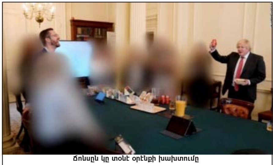
Ճոնսըն կը տօնէ օրէնքի խախտումը

(Աչք ունեցողը թող տեսնէ, ականջ ունեցողը թող լսէ, դատողութիւնը չկորսնցնողն ալ թող դատէ եւ գործի անցնի):