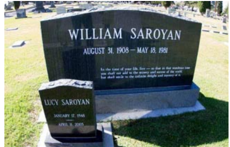
Կարլեն Դալլաքեան «Յուշապատում. դէպքեր, իրողութիւններ, մտորումներ»:

Ան մասնաւորապէս կը յիշէ. «Ամերիկայէն լուր ստացանք, թէ պիտի բերեն Ուիլիըմ Սարոյեանի աճիւնի սափորներէն մէկը: Մեծ վարպետը կտակած էր՝ իր աճիւնները ամփոփել երեք սափորներու մէջ. մէկը տանիլ Երեւան եւ յանձնել մայր հողին, միւսը թողուլ Ֆրեզկոյի մէջ, իսկ երրորդը օղէն սրսկել Պիկետի վրայ, երբ ան ազատագրուի: Գրողի վերջին փափաքի առաջին երկու կէտը իրականացաւ անյապաղ: Պատուիրակութիւն մը ժամանեց Երեւան, իր