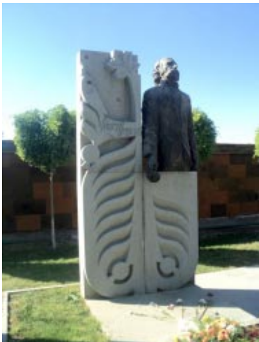
Ինչո՞ւ թերեւոյժ աճիւնի սափորը: Արարողութիւնը կատարուեցաւ Կոմիտասի անուան զբօսայգիի պանթէոնին մէջ:

16 Մայիս 1981-ին կը մահանայ Ուիլիըմ Սարոյեան: Սարոյեանի մահուան լուրը արագօրէն կը տարածուի ողջ ԱՄՆ-ի, Եւրոպայի մէջ եւ կը հատէ հորիզոնային Յայաստանի սահմանները: Սարոյեանի մահուան լուրը նախ կը հասնի հորիզոնային Յայաստանի վերնախաւին: Այդ օրերու անցուդարձերուն մասին կը պատմէ պետական գործիչ, գրականագետ Կարլեն Դալլաքեան: