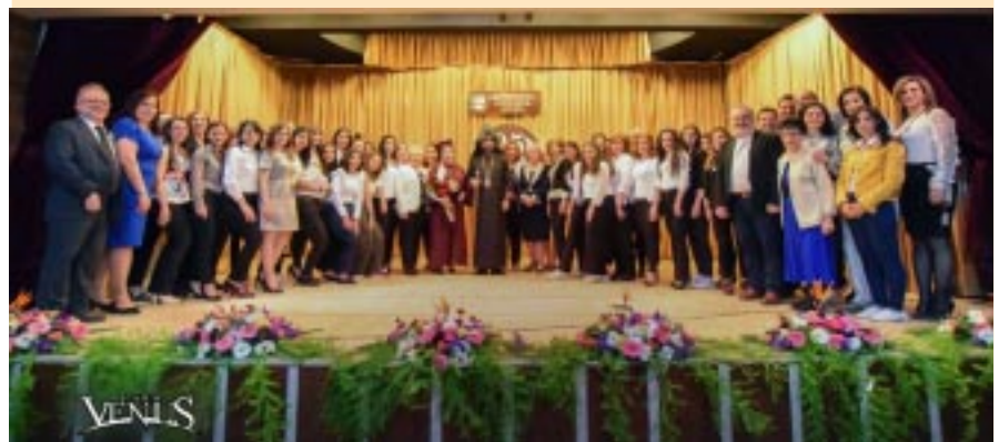
Զամազգայինը, իր կողման հաւատարիմ, կարեւորելով հայ լեզուի մշակին դերը, քսանհինգ տարի առաջ հիմը դրաւ Զամազգայինի Զալէպի Զայագիտական Զիմնարկին:

Ցեղասպանութենէն ճողոպրած եւ Սփիւռքի մէջ հանգրուանած հայը իր առաջնային հարցերէն մէկը համարեց հայապահպանումը: Երբ մարդը հողին վրայ չէ, կը կառչի լեզուին: Լեզուն է այն հիմնական ազդակը, որ օտար ափերու մէջ մարդը կը կապէ իր արմատներուն: