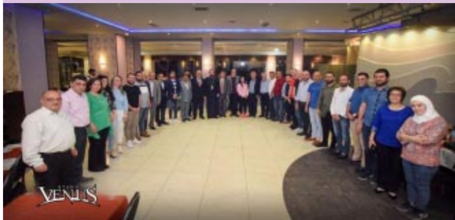
րու ներկայացուցիչները հրաւիրեց «Իֆթարի», «Նիւ Սպիտակ» ճաշարանէն ներս, առ ի գնահատանք անոնց տարած հսկայ աշխատանքին, յատկապէս սուրիական պատերազմի օրերուն:

Իսլամական «Ռամատան» օրինեալ ամսուան առիթով, Զինգշաբթի, 28 Ապրիլ 2022-ի երեկոյեան ժամը 7:00-ին, Բերիոյ Զայոց Թեմի Առաջնորդ Գերշ. Տեր Մասիս Սրբ. Եպս. Չօպուեան Զալէպի բոլոր լրատուամիջոցները