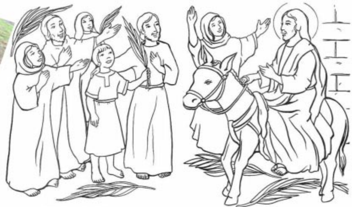
ԳՈՒՆԱՒՈՐԷ՛ հետեւեալ պատկերը: