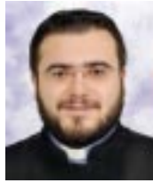
Խորեն Զինյ, Պերթոլեան

Քրիստոս բազմաթիւ անգամներ եւ գանազան առիթներով խօսեցաւ իր կրօնիչը չարչարանքներուն մասին: Ան «Սկսաւ յայտնել իր աշակերտներուն, թէ պէտք է որ ինք երուսաղէմէն դուրս գա, ուր շատ պիտի չարչարուի...» (Մտ 16.21): Ան իր աշակերտներուն ըսաւ նաեւ. «Մարդու Որդին պիտի մատնուի մարդոց ձեռքը, որոնք պիտի սպաննեն զայն, բայց երրորդ օրը անկեղծ յարութիւն պիտի առնէ» (Մտ 17.22-23): Ապա, նախքան երուսաղէմ մուտք գործելը, բացայայտ կերպով խօսեցաւ իր դատապարտութեան եւ Յարութեան մասին, նոյնիսկ որոշապէս մանրամասն անդրադարձ կատարեց եւ կանխելու ծանուցեց, թէ հասած է ժամանակը իր չարչարանքներուն եւ խաչելութեան: Մատթէոս անտարանիչ կը յիշէ, թէ «Աշակերտները շատ տրտմեցան»: Անոնց համար դժուար հասկնալի կը թուէր պատահելիքները: Տիրոջ վերջին օրերը փրկութեան ծրագրին կարեւորագոյն փուլն էին, որմէ անբաժան էին չարչարանքները: Տառապանքի դառնութիւն, ներութեան սաստկութիւն, տագնապի գագաթնակէտէն հոգեկան յուզում ապրեցաւ մեր Տէրը՝ Յիսուս: Մարգարէին վկայութեամբ՝ «Վիշտերու տէր ու ցաւերու տեղեակ եղաւ» (Ես 53.3):