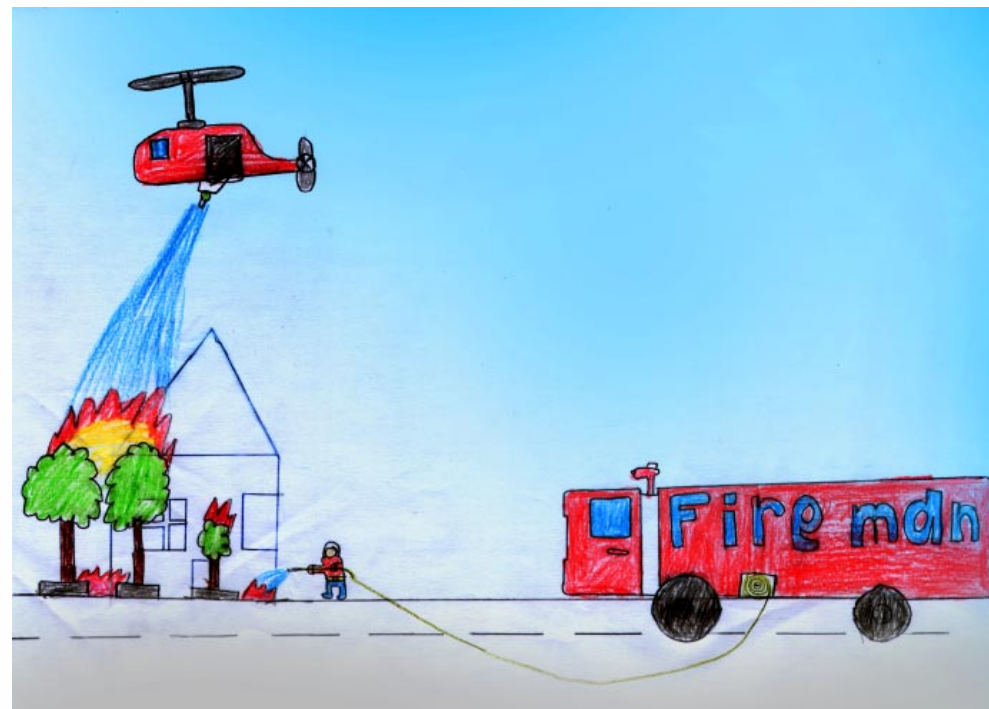
Առէն Արամեան 7. կարգ Ազգ. Միացեալ Նախակրթարան-Յալէպ