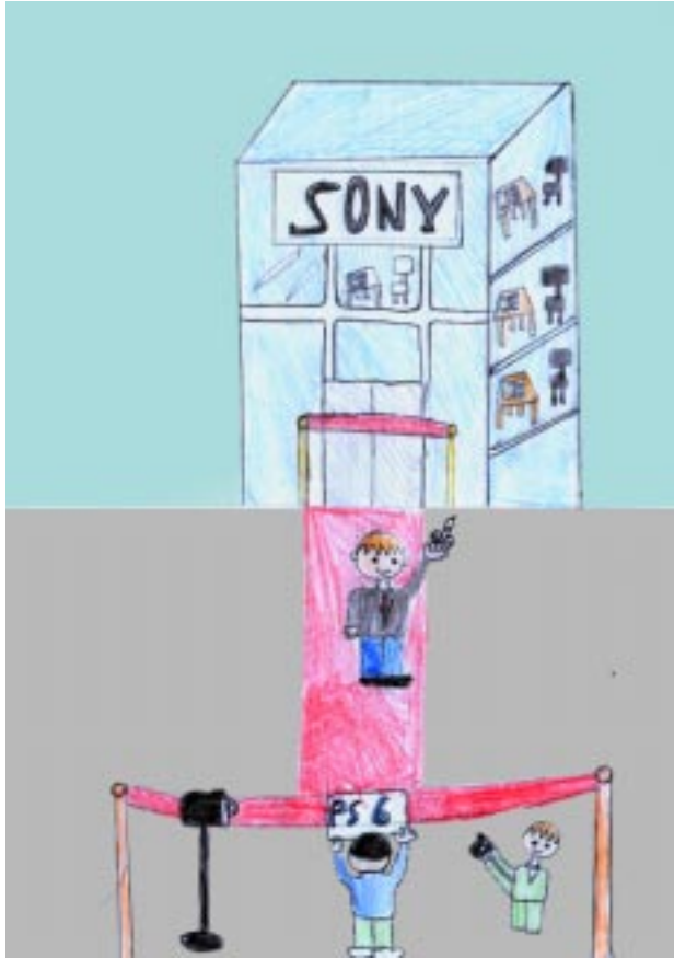
Կարեն Երեցեան 2. կարգ Ազգ. Միացեալ Նախակրթարան-Յալէպ