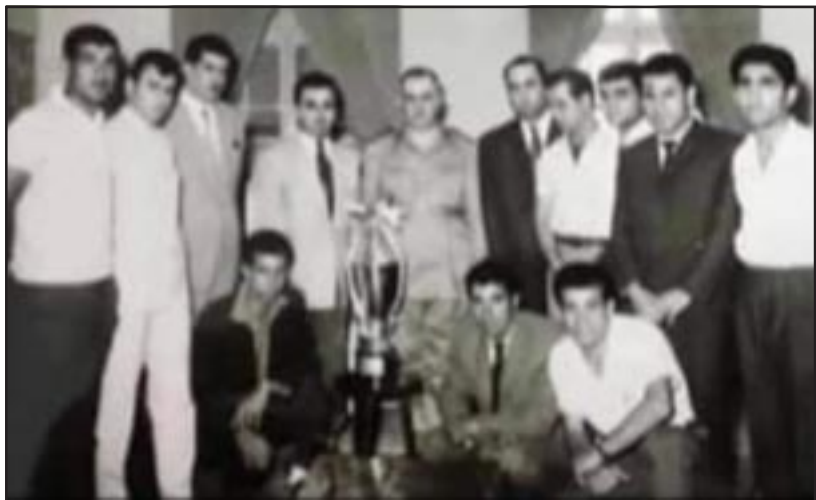
Խումբին այցելութիւնը Սուրիոյ Զիւսիսային շրջանի գինուորական բանակի ղեկավարին

Իրաւարարի ազդանշանին վրայ խաղը սկսաւ Ահլիի յարձակումով, սակայն ՀՄԸՄ-ի բերդապահը եւ յետսապահ գիծը կասեցուցին Ահլիի բոլոր գոռիները: Առաջին կիսախաղը, հակառակ Ահլիի ճնշումին ու կոշտ խաղարկութեան, հաւասարութեամբ վերջ պիտի գտներ, եթէ իրաւարարներ, յատկապէս Լիբանանէն: