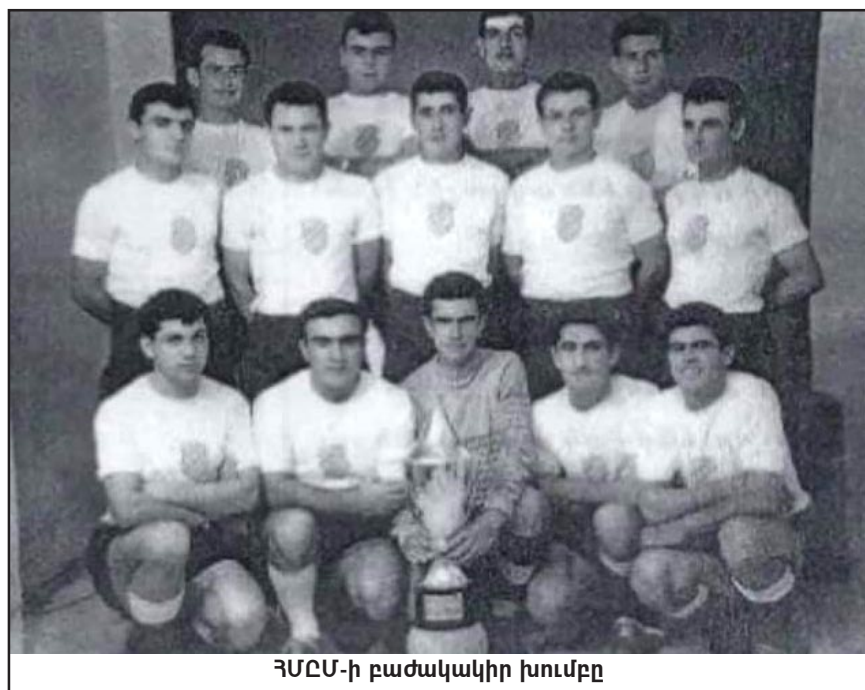
ՀՄԸՄ-ի բաժակակիր խումբը

Մրցումի ընթացքին ՀՄԸՄ ստացաւ 7 անկիւնային հարուած (corner), իսկ Ահլին՝ 13: ՀՄԸՄ-ի հաշուոյն 13 կանոնախախտում (foul) արձանագրուեցաւ, իսկ Ահլիի՝ 3: Մրցումին ներկայ էին օտար բազմաթիւ