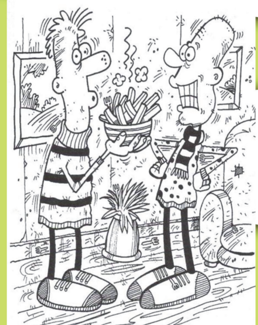
Կրնա՞ս գտնել պատկերին մէջ պահուած ութը պատառաքաղները: