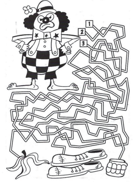
Կրնա՞ս գտնել հտպիտին կօշիկներուն հասցնող ճամբան: