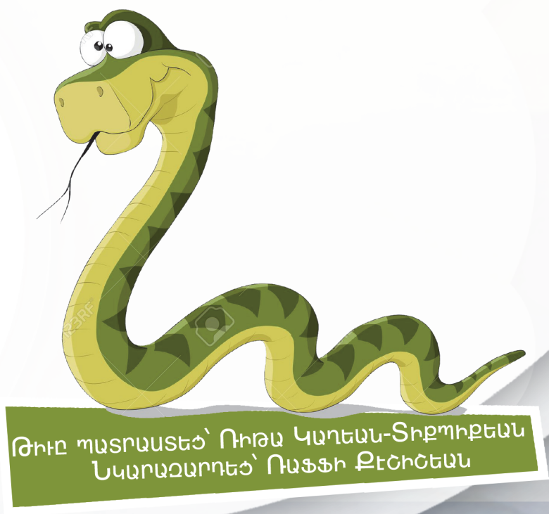
ԹԻՒՆ ՊԱՏՐԱՍՏԵՃ՝ ՈՒՌԱՆ ԿԱՐՆԵԱՆ-ՏԻՐՈՒՔԵԱՆ ՆԿԱՐԱՉԱՐՈՒՅԵՃ՝ ՈՒՅՅԻ ՔԵՇՈՒՅԵԱՆ

Թագաւոր մը, օճ մը ունէր, որ իրեն ամէն օր ոսկի դահեկան մը կը բերէր: Թագաւորը մանուկ մը ունեցաւ: Օճն ու մանուկը միասին կը խաղային: Անգամ մը մանուկը սուրը հանեց, կտրեց օճին պոչը եւ գետին նետեց: Օճը զայրացաւ, խայթեց մանուկը եւ գնաց օտար երկիր: Երբ թագաւորը եկաւ եւ տեսաւ զաւկին դիակն ու օճին պոչը, հասկցաւ ամէն բան: Ան սգաց զաւակը ու տարաւ թաղեց գերեզմանոց: Անցաւ ժամանակ: Թագաւորը մարդ ուղարկեց օճին մօտ եւ ըսաւ. -Ինչ որ եղաւ՝ եղաւ. ի գուր գացիր: Եկո՛ւր միասին ապրիկը եւ մենք առաջուան պէս իրարու հետ սիրով ըլլանք: Օճը պատասխանեց. -Այդպէս չէ, քանի որ ես պիտի նայիմ իմ պոչիս, իսկ դուն քու զաւկիդ գերեզմանին. ուրեմն մեր միջեւ թշնամութիւնը պիտի չվերանայ: Լաւն այն է, որ դուն եւ ես իրարմէ հեռանանք, որպէսզի ուրիշ չարիք չծնի մեր մէջ: