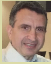
Snpj. Shghrasn Phyladets

«21 Սեպտեմբեր 1991, Խորհրդային Հայաստանի սոցիալիստական հանրապետություն - հարց՝ -Համաձայն էք, որ Հայաստանի Հանրապետությունը լինի անկախ, ժողովրդավարական պետություն ԽՍՀՄ-ի կազմից դուրս: Արդյունքը. Այո՝ 2.042.627 99,51%, Ոչ՝ 10.002 0,49%» Այսպիսով իր տրամաբանական ավարտին հասավ 1988 թուականի Փետրուարին Ղարաբաղը Հայաստանին վերամիավորելու միտումով սկիզբ