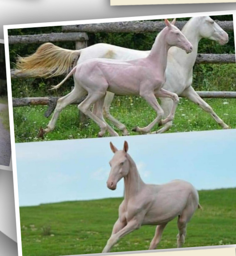
Ճաղատ ու վարդագոյն երանգով ձի