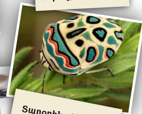
Տարօրինակ բզեզ մը