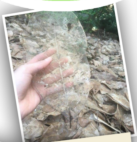
Թափանցիկ տերեւ մը