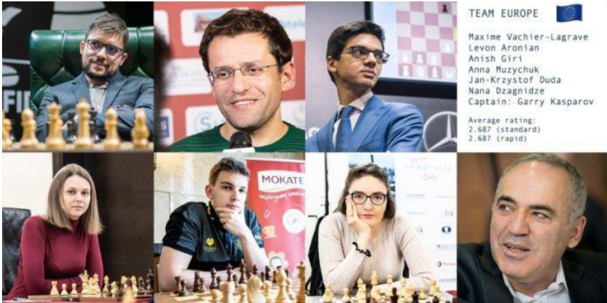
TEAM EUROPE Maxime Vachier-Lagrave Levon Aronian Anish Giri Anna Muzychuk Jan-Krzysztof Duda Nana Dzagnidze Captain: Garry Kasparov Average rating: 2.687 (standard) 2.687 (rapid)

ՖԻՏԵ-ի մամուլը էջը յայտարարեց, որ Հայաստանի ճատրակի առաջատար Լեոն Արոնեան պիտի մասնակցի ՖԻՏԵ-ի եւ Chess.com-ի կողմէ կազմակերպուած «Ազգերու Բաժակ» առցանց մրցաշարքին: Մրցաշարքին կը մասնակցին 6 հաւաքականներ. Եւրոպայի հաւաքականը, ԱՄՆ-ի հաւա-