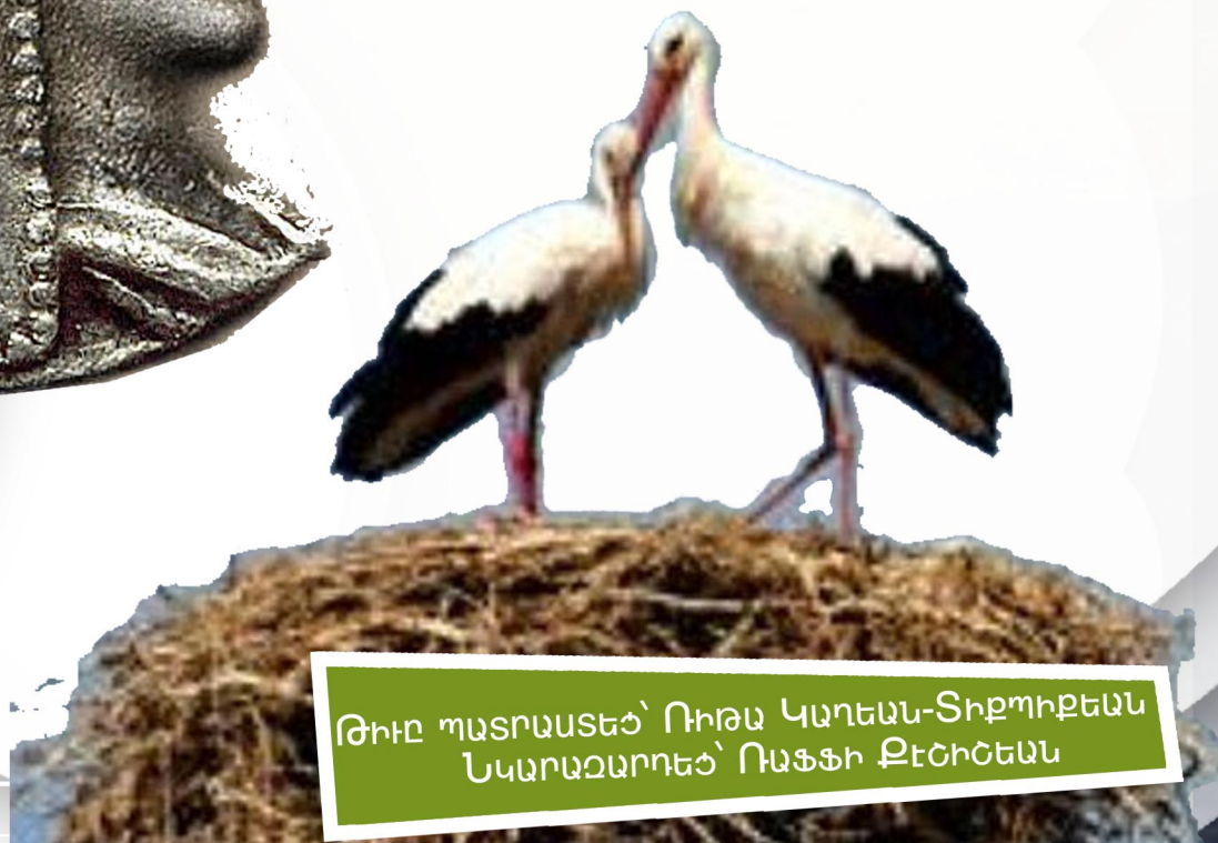
ԹԻՒԸ ՊԱՏՐԱՍՏԵՑ՝ ՈՒԹԱՆ ԿԱՌԵԱՆ-ՏԻՐՊՈՒՔԵԱՆ ՆԿԱՐԱՉԱՐՈՒՅՑ՝ ՈՒՅՅԻ ՔԵՇՈՇԵԱՆ

Բազմաթիւ երգեր, առակներ եւ բանաստեղծութիւններ գրուած են արագիլներուն: