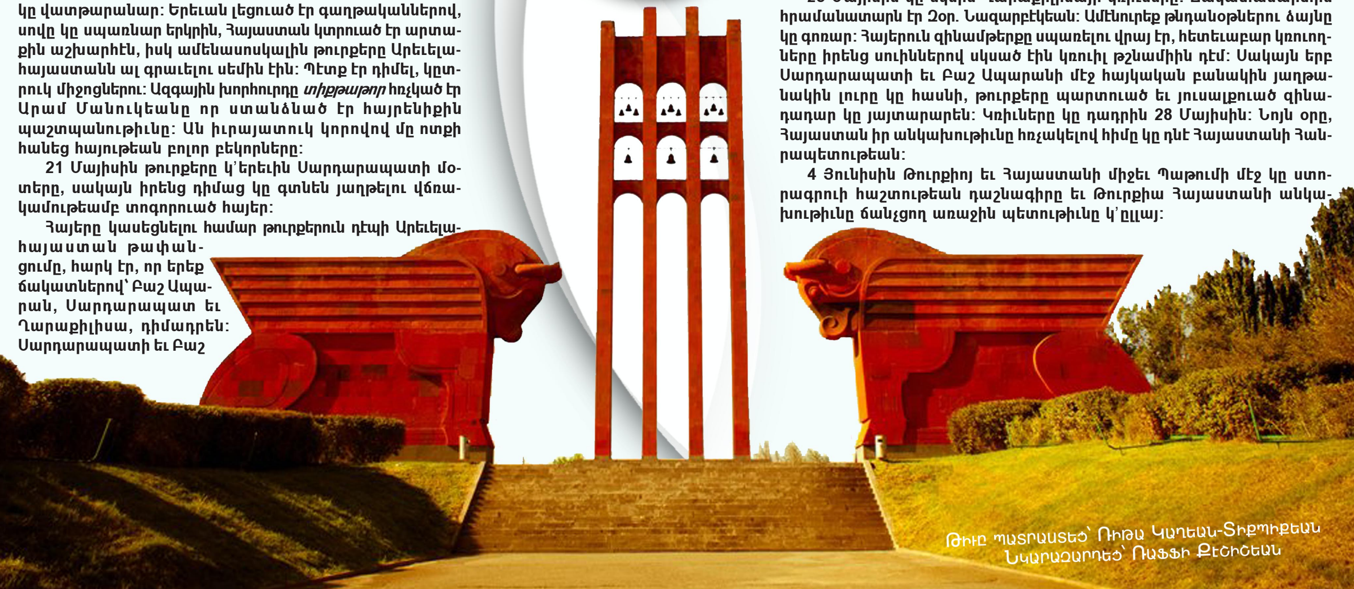
ԹԻՒԸ ՊԱՏՐԱՍՏԵՆ՝ ՈՒՐԱՆ ԿԱՐԵԱՆ-ՏԻՐՈՒՔԵԱՆ ՆԱԿՐԱԶԱՐՈՒՅԵՆ՝ ՈՒՅՅԻ ԲԵՇՈՒՅԵԱՆ

4 Յունիսին Թուրքիոյ եւ Հայաստանի միջեւ Պաթումի մէջ կը ստորագրուի հաշտութեան դաշնագիրը եւ Թուրքիա Հայաստանի անկախութիւնը ճանչցող առաջին պետութիւնը կ'ըլլայ: