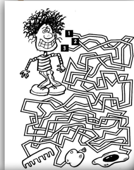
Կրնա՞ս գտնել սանտրին հասցնող ճամբան:

Կրնա՞ս վարի տախտակը ամբողջացնել 1, 2 և 3 թիվերով: Իրաքանչիւր շարքի եւ սիւնակի մէջ պետք է գետեղել այս թիւերը՝ առանց զանոնք կրկնելու: Թիւերուն շարքը կարելուր չէ: