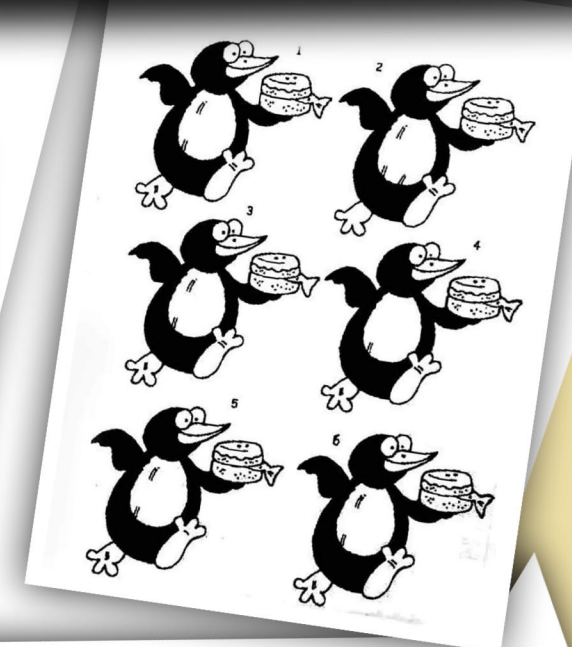
Կրնա՞ս գտնել իրարու նմանող երկու կերպարները: