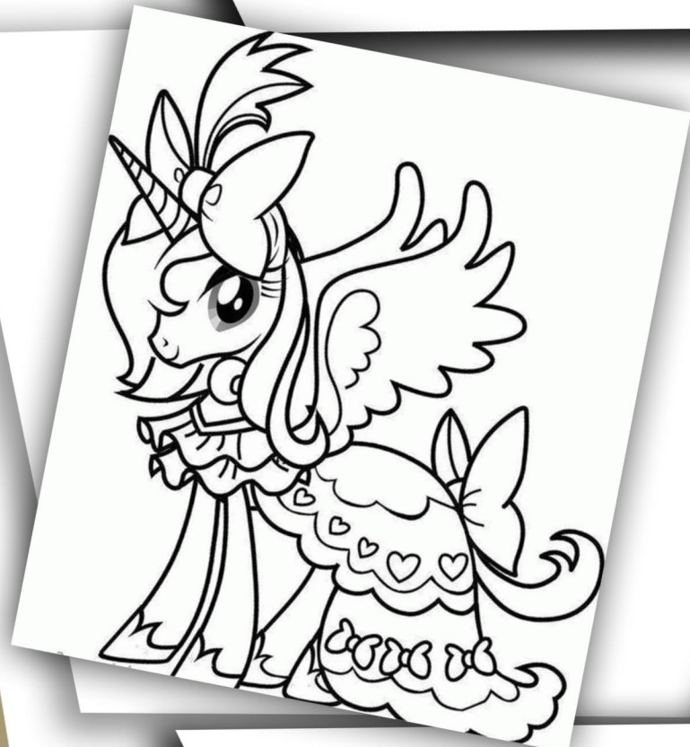
Ներկե՛՛ նախասիրած գոյներով