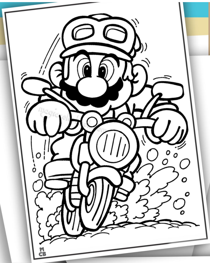
Ներկե՛՛ նախասիրած գոյներով