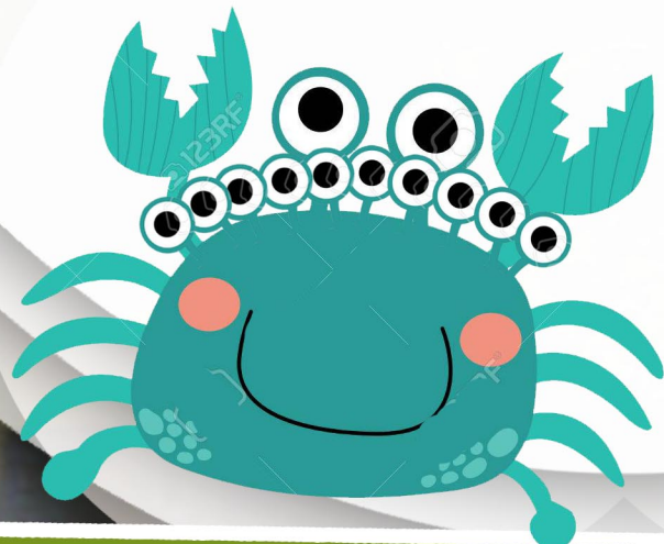
Թիւ աստուստ՝ Ռիթա Կարեն-Տրոյիբեան Նպաստող՝ Ռաֆի Բեօրեան