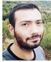
Պատրաստեց Պետիկ Աշոտեան