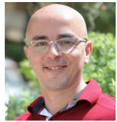
Պատրաստեց Ռաֆֆի Միլախեան