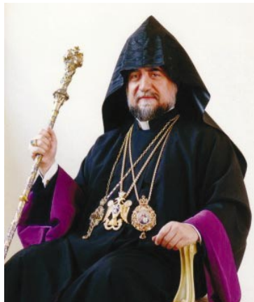
Հայրական ջերմ սիրով: 1 Յունուար 2019 Անթիլիաս Շար.՝ Էջ 8 ➤

Կը գտնուիք Նոր Տարուան սեմին: Մեր կեանքին մէջ Նոր տարին հաւ- գրուան մըն է՝ ինքնահայեցողութեան ու ինք- նաքննութեան ճամբով մեր անձին հետ ըլ- լալու: Մեր անձին հետ ըլլալ, կը նշանակէ անցնող օրերուն մեր ապրած կեանքը ու մեր կատարած գործը քննել ու արժեւորել: Վըս- տահ ենք, որ մեզ մէ իւրաքանչիւրը իրագոր- ծումներ կատարեց, յաջողութիւններ ունե- ցաւ, բարիքներ գործեց. միաժամանակ, որ- պէս անկատար արարածներ, թերացումներ ունեցաւ, սխալներ գործեց: Այդ բոլորի մա- սին հարկ է մտածել՝ սխալը չկրկնելու յանձ- նառութեամբ: Աստուած, մեր երկնաւոր հայ- րը ներող է, ինչպէս ներեց Անառակ որդիին: Նոր տարուան սեմին, Աստու- ծոյ դիմաց կոչուած ենք վերահաստատելու մեր հաւատքը ու ուխտը՝ քալե- լու Աստուծոյ ցոյց տուած ճանապարհէն, մեր կեանքը բարի գործերով հարըս-