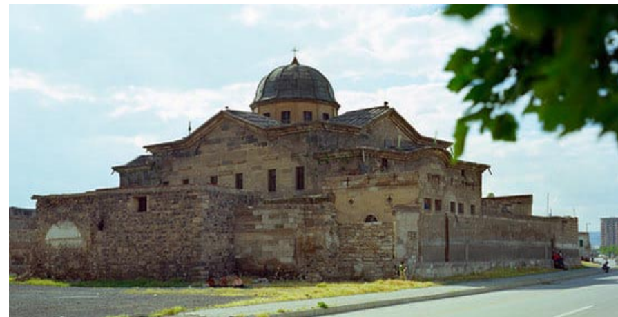
Կեսարիոյ հայոց Ս.Գր. Լուսաւորիչ եկեղեցին

2001-ին ալ ծրագրած ու իրականացուցած էր շարք մը յոբելեանական ուխտագնացութիւններ դէպի գաւառ, քրիստոնէութեան Յայաստանի մէջ ընդունման 1700-ամեակին առիթով: Այս ուխտագնացութիւններէն մէկն ալ՝ դէպի Կեսարիա երթն էր: Կեսարիոյ մէջ դեռ ունէինք Ս. Գրիգոր Լուսաւորիչի անունը