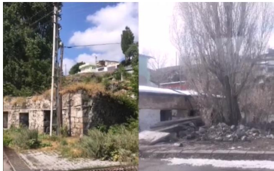
«Թողած Կարսում, գետի ափին տունս շինուած անտաշ քարով, Կարսը թողած, Կարսի այգին ու հայրենի երկինքը մով»:

Ամեն տարի հազարաւոր հայ զբօսաշրջիկներ կ'այցելեն Կարսի բերդի ներքեւի հատուածը գըտնուող այդ շինութիւնը՝ յարգանքի տուրք մատուցելու համարեղ բանաստեղծի յիշատակին: